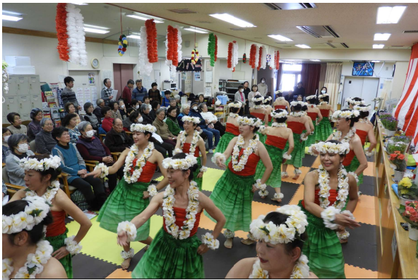
22人のフラ・オハの笑顔いっぱいのダンス